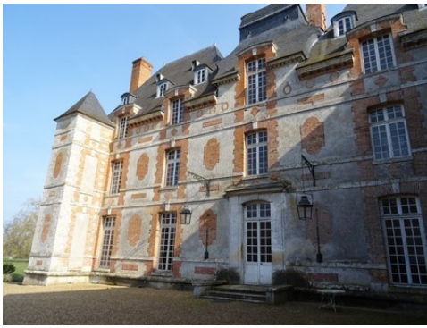
La façade ouest sur la cour