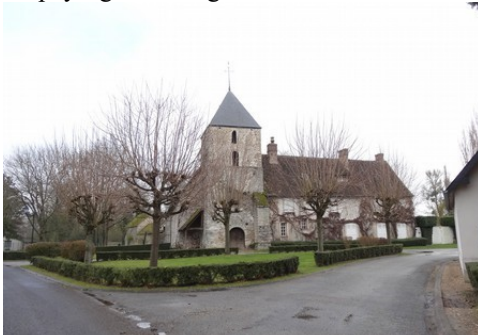
L'église de Neuilly