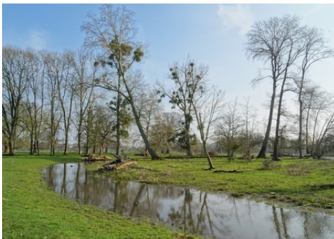
Le paysage des berges de l'Eure

Les avis seront cohérents avec ceux émis ces dernières années, à savoir : pas de maisons à volume compliqué (type V, W, Y, ou Z), pentes à 45° pour les volumes principaux, ardoise ou tuile plate de teinte brun vieilli, à 20u/m 2 , avec un débord de toiture de 20cm, enduit de teinte beige clair avec modénatures (au choix : chaînages, encadrement de fenêtres, soubassement, colombage...). *Voir les autres fiches.