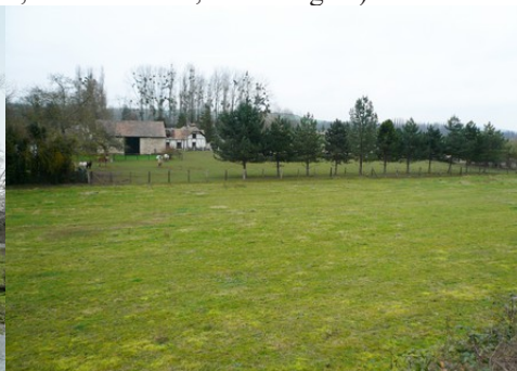
Les espaces de prairies