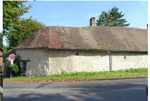
Un édifice en moellons et tuiles plates