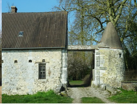
L'accès au château par les communs