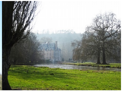
Une vue lointaine depuis le parc