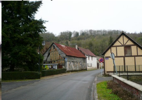
Une rue avec maison à pans de bois