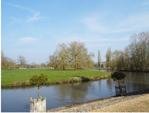
La terrasse sur les berges de l'Eure