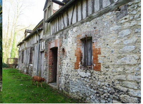
Les anciennes dépendances (vue proche)