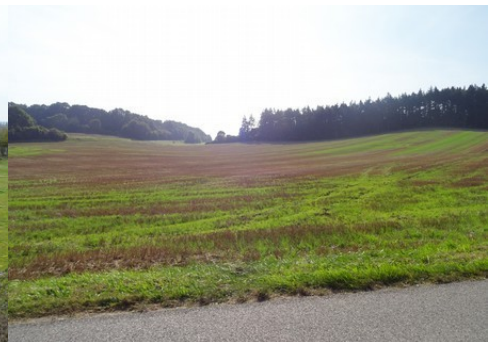
Les champs et les bois alentours