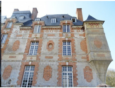
Une vue rapprochée de l'angle nord-est